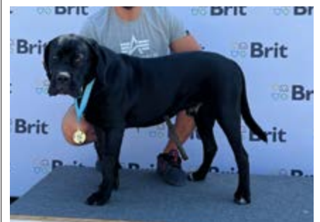
Boro Dall'ombra del Castello

Zkouška ZZO, V1 CAC na národní výstavě psů Brno 8. 1. 2022