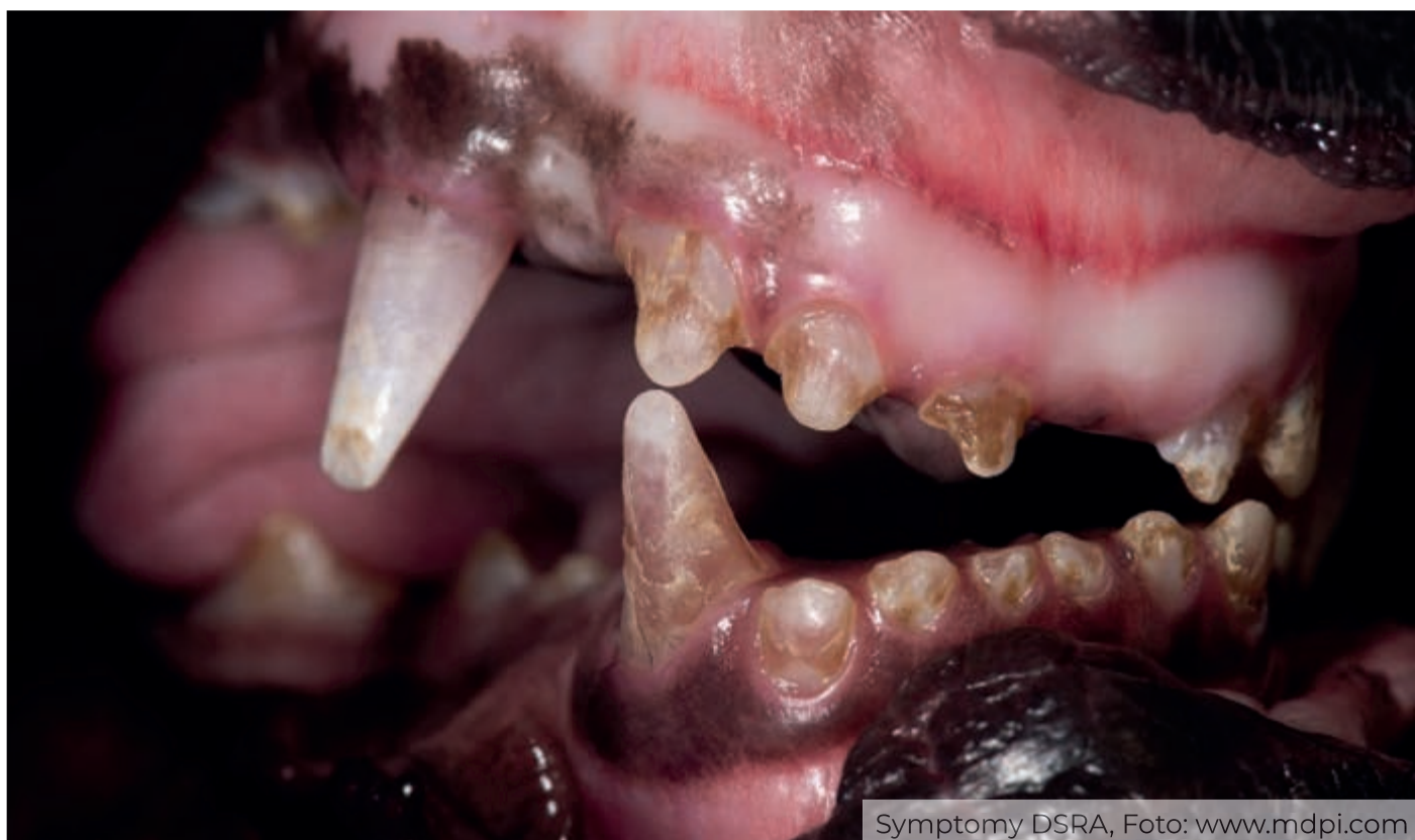
Symptomy DSRA