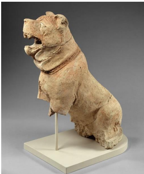
Terakotový pes molossoidního typu z období 2000 let př. n. l. vystavený v Metropolitním muzeu umění v New Yorku

První dochovanou zmínkou o psech typu cane corso je terakotový pes z doby cca 2 000 let př. n. l. Jde o artefakt pocházející z oblasti Ninive, starověkého asyrského města na břehu řeky Tigris, vykazující jasné známky psa molossoidního typu. Aktuálně se nachází v Metropolitním muzeu umění v New Yorku.