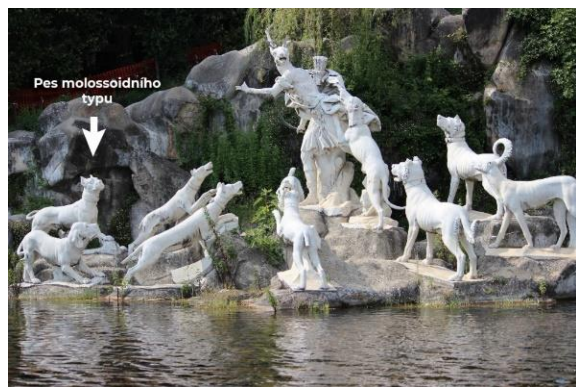
Fontána Diany a Actaeona v Casertě (Karel VII. neapolský král 1735 - 1759)

Jak šel čas, molossoidní psi po celá staletí plnili svou funkci. Byli opravdu nedocenitelným pomocníkem člověka, ať už šlo o hlídání venkovských usedlostí, doprovod farmářů na trhy, hlídání polí nebo lov divoké zvěře. „Plemeno“ si pro své charakteristické vlastnosti oblíbili také někteří panovníci a umělci.